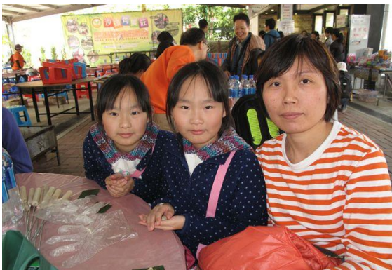
我們和媽媽一起製作美味的茶粿

今次參加的人數多達 240 人。早上我們先到達沙頭角担水坑村參觀，之後到達沙頭角農莊學習製作茶粿及進行燒烤。最後，我們還參觀了附近的紅樹林、水族館及有機農莊等等。經過一天遊覽，大家都帶著愉快的心情回家。