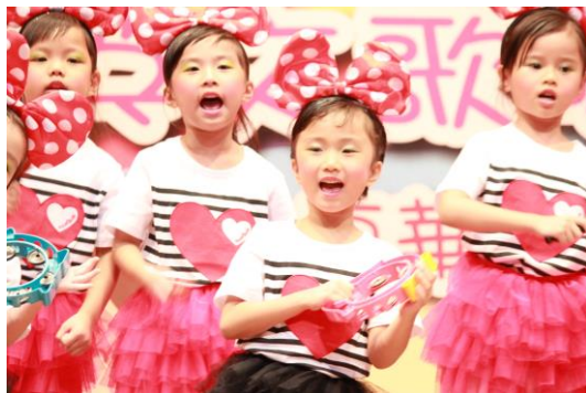
我們的造型多可愛！