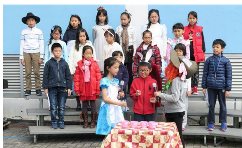
我們像不像故事中的人物呢？

我校本年度英語日的主題是 Alice in Wonderland，當天很多同學悉心打扮成童話故事中的人物，令到校園仿如進入童話世界中！校方又安排了攤位遊戲、電影欣賞及小手工等，讓同學們在輕鬆愉快的氣氛下學習英語。此外，家長義工又把校園佈置得像書中王國一樣，使同學身歷其境，感受故事中的樂趣。最後，同學們的精彩表演及載歌載舞，把英語日的活動推向高潮！這天真令人回味無窮！