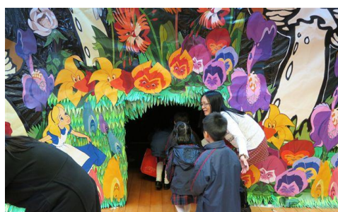
小朋友進入兔子洞探險