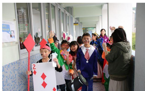
我們去探訪低年級生