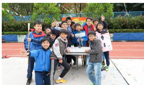
我們的攤位遊戲很受歡迎呢！