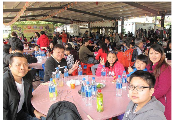
大家一起享受美味的燒烤午餐