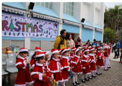
聖誕妹妹笑容多燦爛

二零一四年十二月十九日是我校的聖誕嘉年華，這天同學們不用上課，可以盡情的玩攤位遊戲及換領禮物，人人都非常開心，校園瀰漫著一片歡樂獻唱學生的精彩表演，聖誕小人兒，加添我們