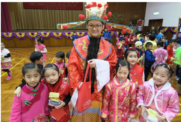
財神和同學們向大家拜年

二月十三日為本校一年一度的中國文化日，本年度的主題為「書法」。老師們安排了一連串既豐富，又精彩的節目，讓同學體驗中國的傳統文化，當中包括了多元化的攤位遊戲、展板、中國民間小食及親子廚藝大比拼。同學及家長都十分投入當天的活動，校園內洋溢着一片新春氣氛，當日財神及水滸傳英雄「豹子頭」林沖更與大家一起歡度文化日呢！這天真是一個令人難忘的文化日呢！